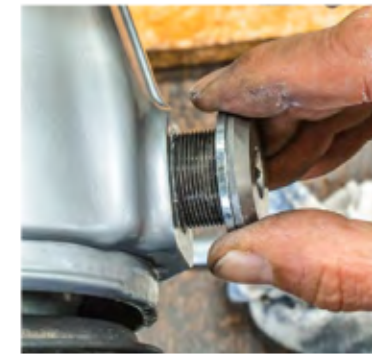
Festlagerzapfen mit Distanzring. Ebenfalls Sonderanfertigungen